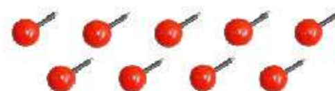
ヘルメットフック・・・9本